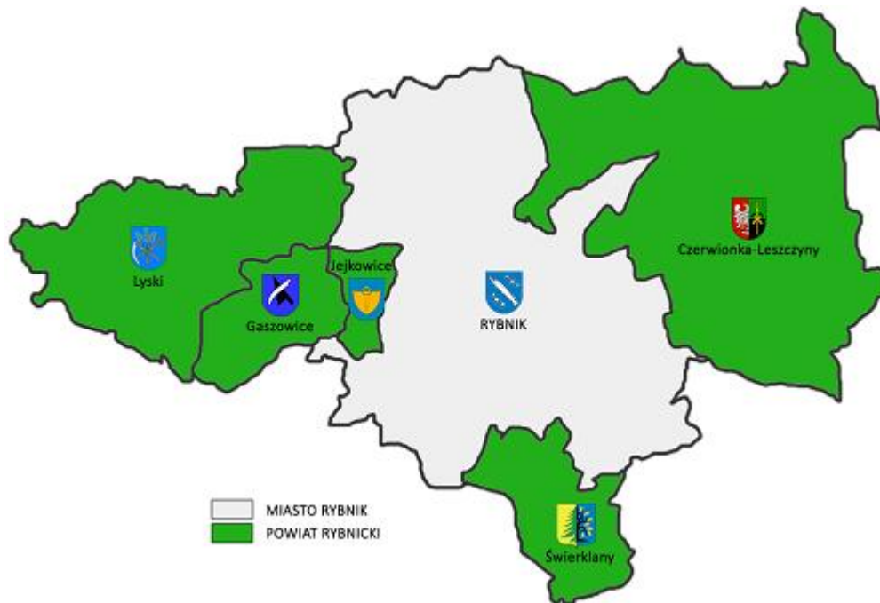
Rysunek 1 Mapa administracyjna powiatu rybnickiego

Powiat rybnicki znajduje się w południowo-zachodniej części województwa śląskiego i Górnośląskiego Okręgu Przemysłowego. Sąsiaduje on z trzema miastami na prawach powiatu: Rybnikiem, który stanowi siedzibę powiatu, Jastrzębiem-Zdrojem i Żorami, a także z czterema powiatami ziemskimi: gliwickim, mikołowskim, raciborskim oraz wodzisławskim. W skład powiatu rybnickiego wchodzi gmina miejsko-wiejska Czerwionka-Leszczyzny oraz gminy wiejskie: Gaszowice, Jejkowice, Lyski, Świerklany.