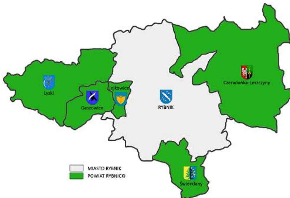
Rysunek 1 Mapa administracyjna powiatu rybnickiego

Powiat rybnicki znajduje się w południowo-zachodniej części województwa śląskiego i Górnośląskiego Okręgu Przemysłowego. Sąsiaduje on z trzema miastami na prawach powiatu: Rybnikiem, który stanowi siedzibę powiatu, Jastrzębiem-Zdrojem i Żorami, a także z czterema powiatami ziemskimi: gliwickim, mikołowskim, raciborskim oraz wodzisławskim. W skład powiatu rybnickiego wchodzi gmina miejsko-wiejska Czerwionka-Leszczyzny oraz gminy wiejskie: Gaszowice, Jejkowice, Lyski, Świerklany.